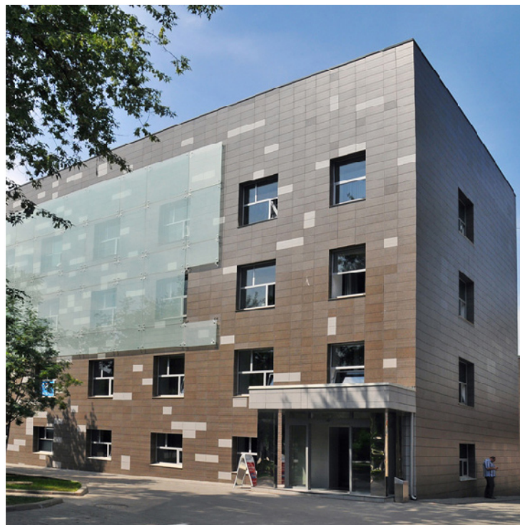
Бизнес-центр класса «В+»